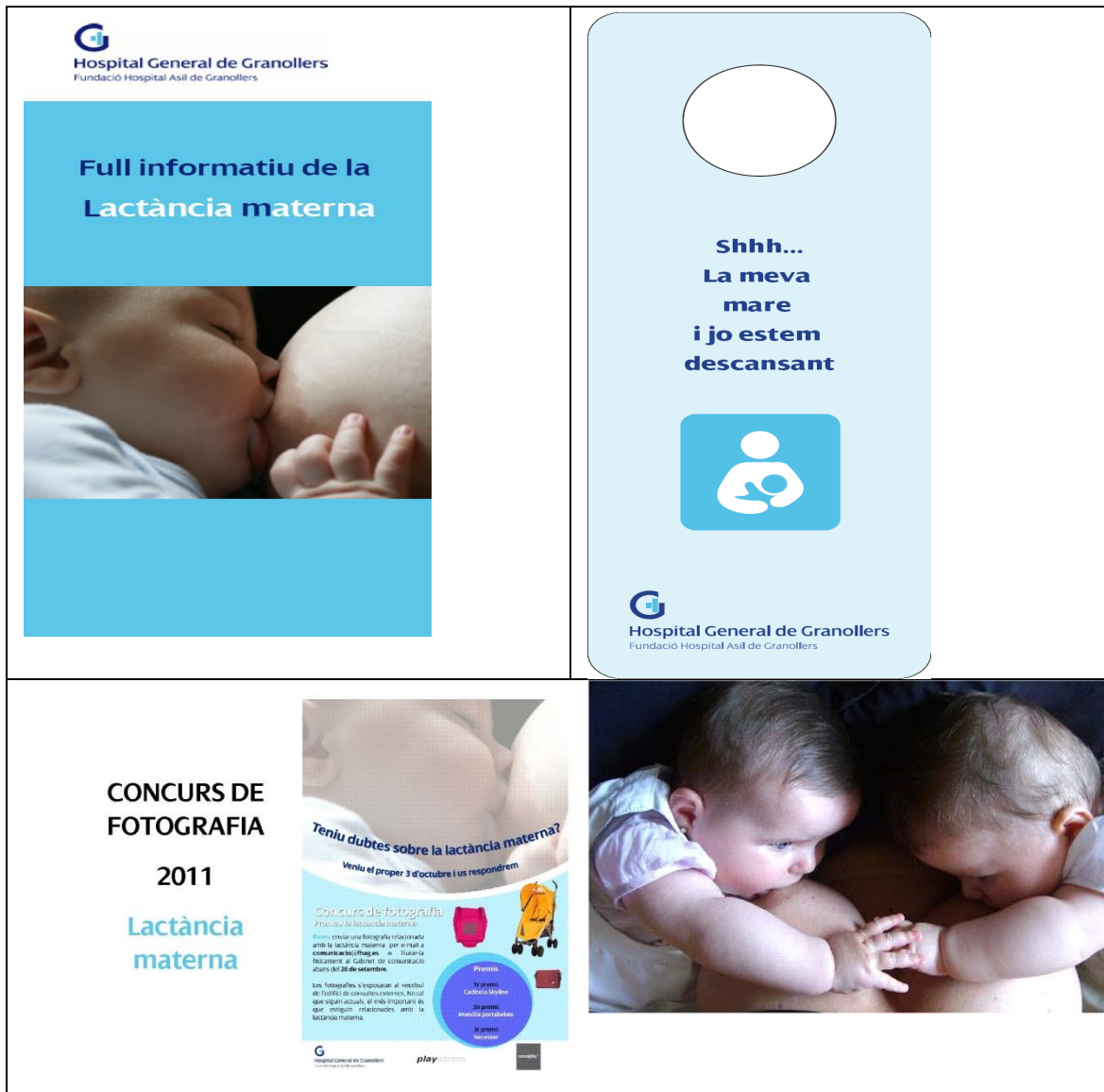
Imatge 1. Alguns dels fulletons informatius i d'accions de la Comissió de Lactància