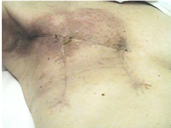
Fig. 6: Resultado tras radioterapia.

Posteriormente continuo la quimioterapia ( Taxol x 6) y recibí RT locorregional (Fig. 6), sin complicaciones. Actualmente esta sin signos de recidiva locoregional ni a distancia.