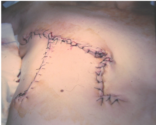
Fig. 5: Sutura del colgajo.