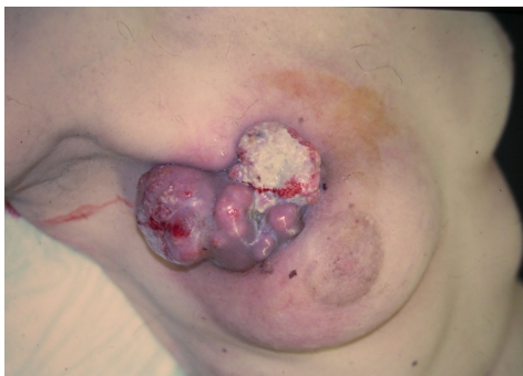
Fig. 1: Tumoración tras neoadyuvancia .

Se decide quimioterapia neoadyuvante (esquema FEC x 4) consiguiendo una reducción parcial de la tumoración (Fig. 1), realizando posteriormente mastectomía radical modificada tipo Madden con amplia resección de piel (Fig. 2).