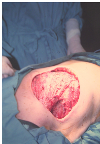
Fig. 2: Aspecto tras la resección.